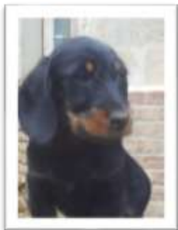
Héla, une des mascottes

Des chiens et des chats partagent le quotidien des enfants.