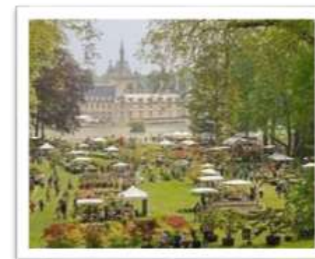
Château de Chantilly